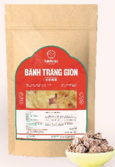
BANH TRANG GIÒN VỊ MƯỚT Crispy Rice Paper with Salted Apricot 豆香脆米糕 20.000 VND