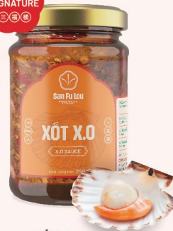
XỐT X.O X.O Sauce X.O醬 228.000 VND