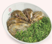
TÔM SÚ SỐNG (06 con) Tiger Prawns 龙虾 188.000 VND