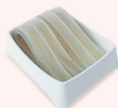
MIẾN KHOAI LANG Sweet Potato Vermicelli 红薯粉丝 48.000 VND

Giá chưa bao gồm thuế GTGT / Prices are exclusive of VAT