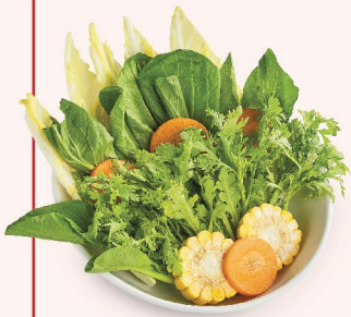
COMBO RAU Vegetable Combo 蔬菜组合 58.000 VND