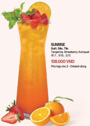
SUNRISE Quýt, Dâu, Tắc Tangerine, Strawberry, Kumquat 橘子、草莓、金桔 138.000 VND Phù hợp cho 2-3 khách dùng