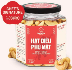
HẠT ĐIỀU PHŨ MẬT Spicy Honey Roasted Cashews 辣蜜腰果 138.000 VND