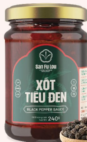
XỐT TIÊU ĐEN Black Pepper Sauce 黑胡椒醬 85.500 VND