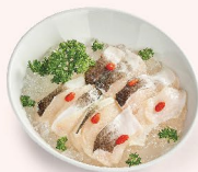
CÁ LĂNG (150gr) Catfish 鲶鱼 108.000 VND