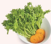
RAU TÂN O Crown Daisy 茼蒿 28.000 VND