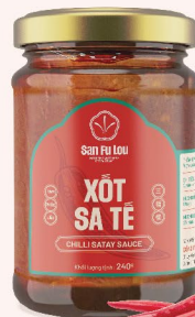
XỐT SA TÊ Chili Sauce 沙爹醬 63.800 VND