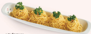
MÌ VẮT TƯƠI Fresh Squeezed Noodles 鲜捞面条 28.000 VND