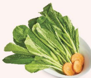
CÁI NGOT HONG KONG Hong Kong Choysum 香港菜心 28.000 VND