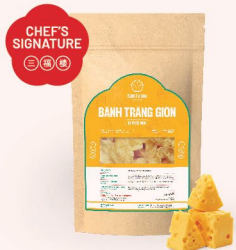
BANH TRANG GIÒN VỊ PHŨ MẠI Crispy Rice Paper with Salted Cheese 咸蛋香脆米糕 20.000 VND