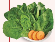
CÁI BO XOI Spinach 菠菜 28.000 VND