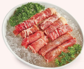
COMBO THỊT BÒ (180gr) Beef Combo (180gr) 牛肉套餐 (180克) 228.000 VND