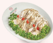
BẠCH TUỘC BABY (06 con) Baby Octopus 小章鱼 108.000 VND