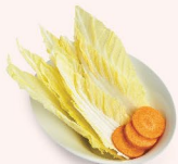
CÁI THẢO Cabbage 大白菜 28.000 VND