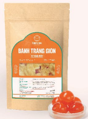
BANH TRANG GIÒN VỊ TRỨNG MUỐI Crispy Rice Paper with Salted Egg 芝士辣脆米糕 20.000 VND