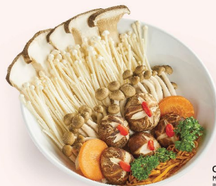
COMBO NẤM Mushroom Combo 蘑菇组合 88.000 VND