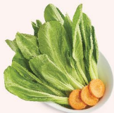
CÁI THIA Bok Choy 小青菜 28.000 VND